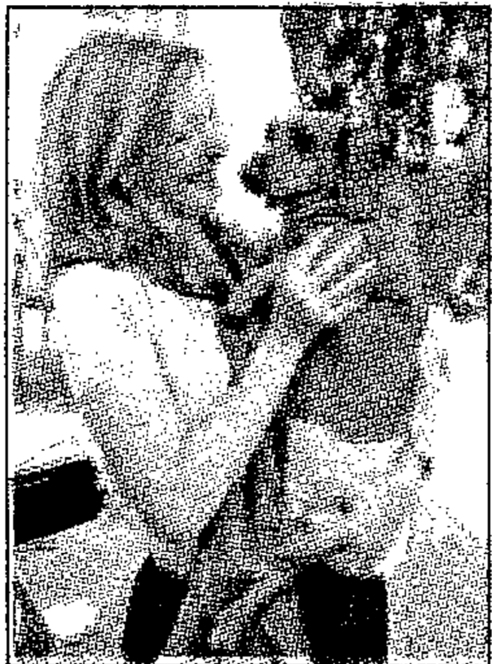
Primo soccorso ai cani